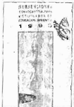
Subvenciones para educación

El plazo máximo de presentación de solicitudes finaliza el próximo día 6 de mayo a las 12 horas.