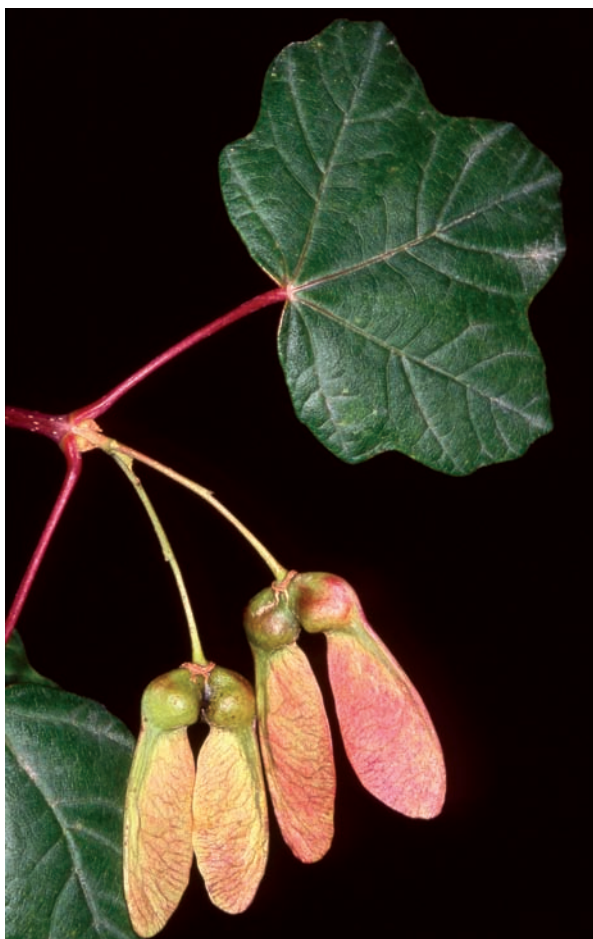
Fig. 2. Acer granatense .