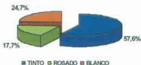
Gráfico 4. Tipo de vino de D.O. consumido

En cuanto a la tipología del vino de D.O. consumido (Gráfico 4), más de la mitad beben vino tinto y, en menor medida, vino rosado y vino blanco.