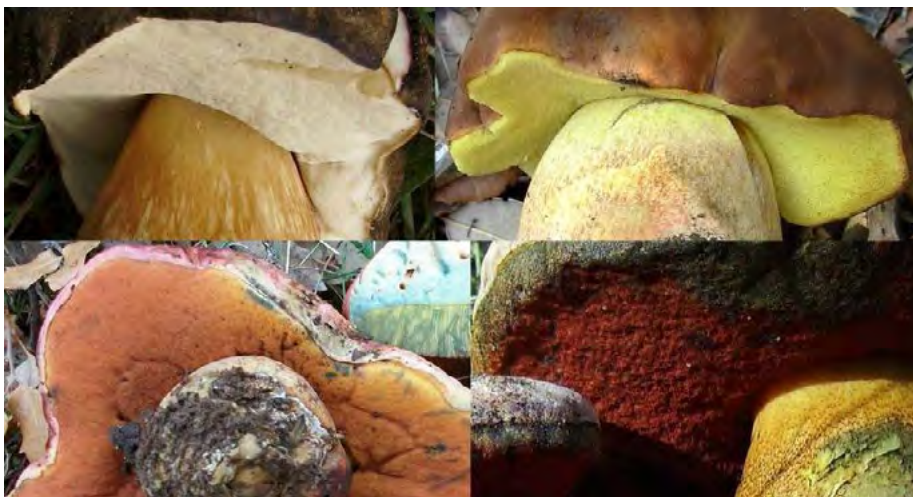
Figura 1. Diversidad de colores del himenio en Boletus sensu lato.

blanco, amarillo, anaranjado o rojo (figura 1). A menudo, el color de los poros varía con la maduración del cuerpo fructífero. El himenio es adnato (pegado al pie) cuando los ejemplares son jóvenes, con la edad puede terminar siendo semilibre en ejemplares muy viejos.