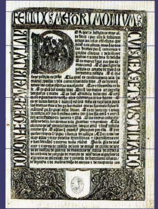
"Ordenanzas de la Real Academia de la Historia" (1492). Documento custodiado en el Archivo Histórico Nacional.

El trabajo de Navarro Tomás en el Archivo Histórico Nacional comenzó en 1910.