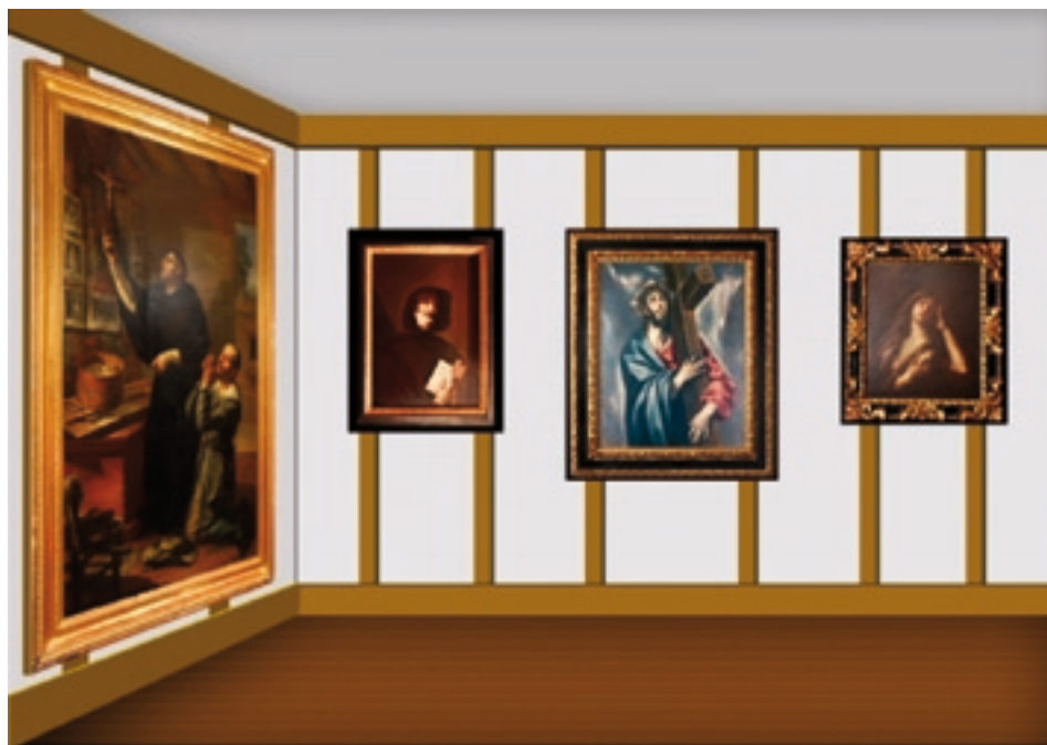
Imagen 5. Recreación virtual del Museo Parroquial de El Bonillo, donde está expuesto el cuadro, junto al de "La Magdalena" atribuido a Andrea Sarto, un "San Francisco", copia de José Ribera "El Españolito", y "El Milagro" de Vicente López. -.Recreación: Luis David Carrión García.