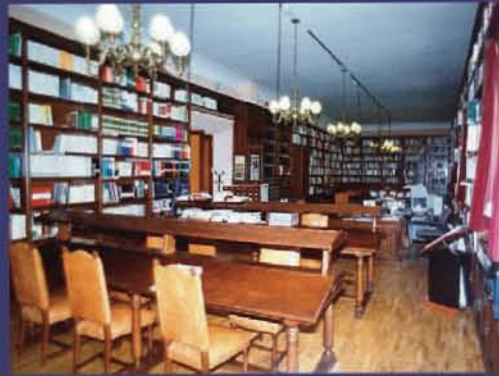
Biblioteca "Tomás Navarro Tomás" del Museo de Albacete (Albacete)

2002: El 14 de noviembre, en sesión ordinaria de la Junta Directiva, se acordó dar el nombre de "Tomás Navarro Tomás" a la Biblioteca del IEA.