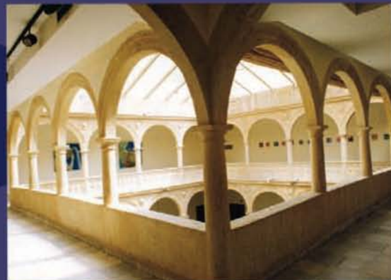
Centro del Centro Cultural de 'La Alcazola' donde se celebró el Encuentro de Estudios Albacetenses

Ciudad he considerado Albacete como punto de partida de mi carrera académica. En 1897 era yo un muchacho tímido y retraído que fue a Albacete a examinarse del primer año del grado bachiller, para el cual me había preparado en el colegio de La Soledad incorporado al Instituto. La distinción de sobresaliente recibida en esos exámenes me dio confianza para las muchas empresas académicas que me aguardaban en la carrera. Fue ahora en el nombramiento de miembro de honor del Instituto de Estudios Albacetenses al enlazar finel en el círculo de mis distinciones profesionales. Le ruego haga presente a la corporación mi agradecimiento por el honor que me ha conferido. Le saluda atentamente, T. Navarro Tomás T. Navarro Tomás