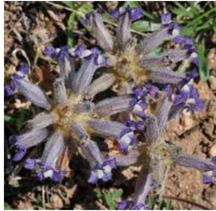
Figura 14. Phelipanche resedarum . Vista cenital de unas inflorescencias.