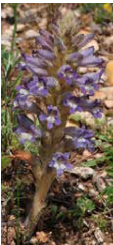
Figura 15. Phelipanche resedarum . Hábito.