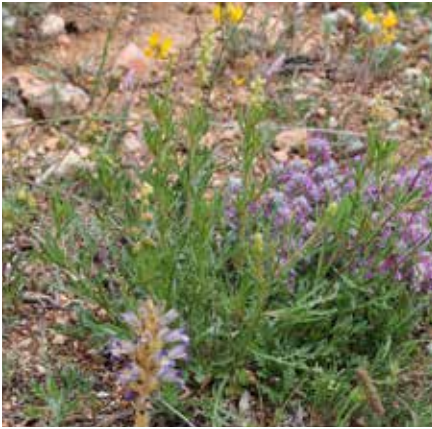
Figura 13. Phelipanche resedarum junto a Reseda lutea subsp. lutea .

Carlón, L. et al. (2005); Carlón, L. et al. (2008); Gómez, J. (2011); Gómez, J. et al. (2013); Mota, J. F. et al. (2011); Salguero, P. A. (2010); Sánchez Pedraja, Ó. (2016); Triano, E. (2010). Triano, E. y Pujadas, A. J. (2011).