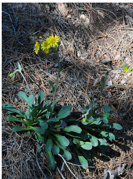
Figura 19. Jacobaea auricula .