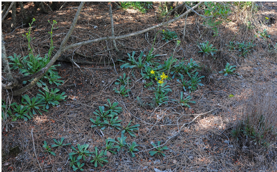
Figura 18. Jacobaea auricula . Detalle de la nueva población encontrada.

J. (1990); Pelsler, P. B. et al. (2006) y (2007); Salmerón, E. et al. (2017); Sánchez Gómez, P. et al. (1997); Valdés, A. y Gómez, J. (2018); Valdés, A. et al. (1993); VV.AA. (2000); Willkomm, M. (1893).