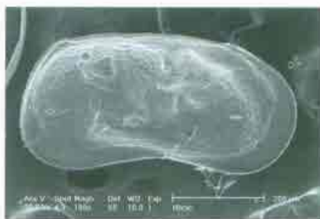
Fotografías 21 y 22. Vista dorsal de Darwinula stevensoni (izquierda) y vista interna de la valva izquierda de Limnocythere inopinata (derecha) donde podemos observar unas pequeñas espinas características de esta especie en la parte posterior de la valva.