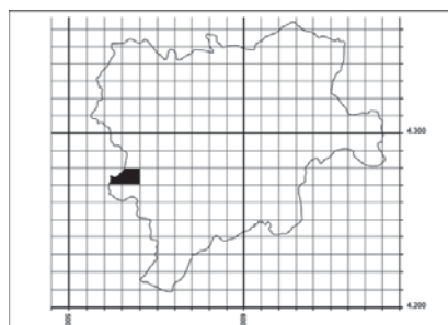
Figura 57. Distribución de Notholaena marantae subsp. marantae en la provincia de Albacete.