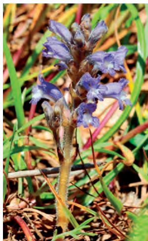
Fig. 20. Phelipanche nana . Hábito.