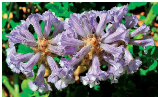
Fig. 19. Phelipanche nana . Vista cenital.

Anthos (2015); BDBCv (2015); Bolòs, O. de y J. Vigo (1996); Carlón, L. y cols. (2005a) y (2005b); Carlón, L. y cols. (2008); Foley, M. J. Y. (2001); García Navarro, E. (1996); Gómez, J. (2011); López Sáez, J. y cols. (2002); Molina, R. (2003); Molina, R. y cols. (2008); Peris, J. B. (1983); Pujadas, A. J. y cols. (2007); Sánchez Gómez, P. y cols. (1987).