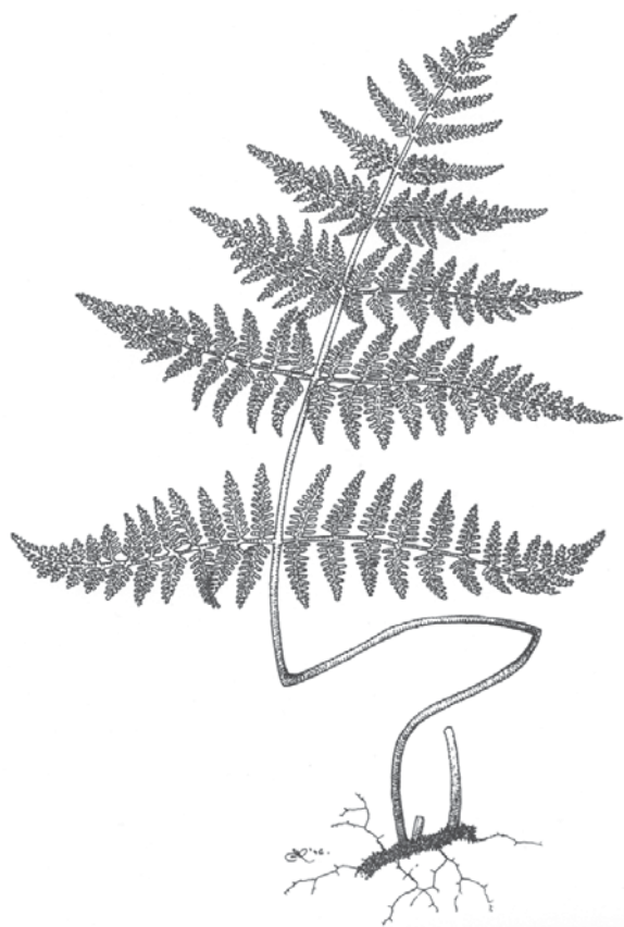
Figura 66. Aspecto de los individuos de la especie (A) y del esporangio con las células del anillo de dehiscencia (B). Román Belmonte.