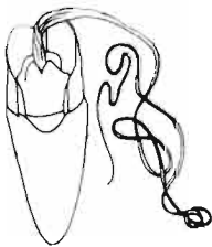
Genitalia ♂ Dorcus parallelepipedus