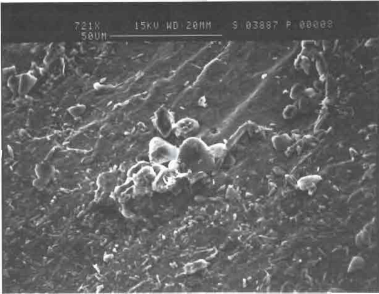
Fig. 16: Microestructura masiva de ópalo C-F con «istas» en las que se han preservado frústulas de diatomeas bien conservadas. Nódulo de sílex negro centimétrico, niveles de chert de la base de la cantera CEKESA. Imagen de Microscopía Electrónica de Barrido.