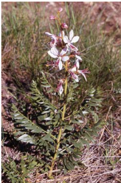
Fig. 9. Dictamnus hispanicus