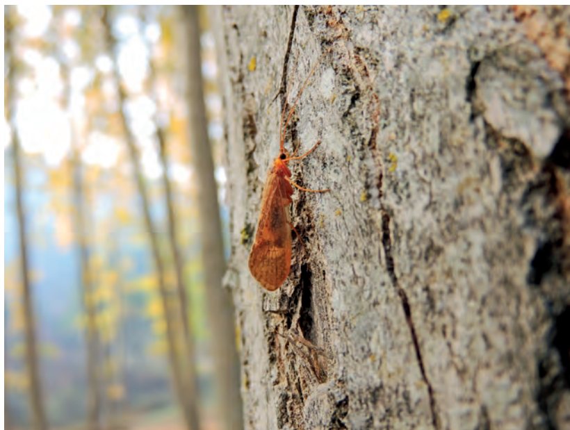
Figura 8. Macho de Allogamus mortoni , Los Carrizales, 21/X/2014.