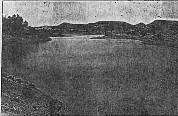
La política local del agua, caballo de batalla del moderno urbanismo.